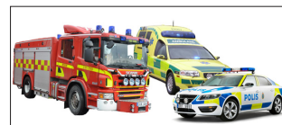
Räddningsfordon måste komma fram.

Denna gång var det hemtjänsten som orsakade problemet och de är kontaktade. Men detta är en påminnelse för oss alla.